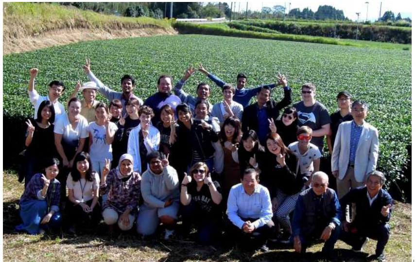
秋晴れの茶園で記念撮影