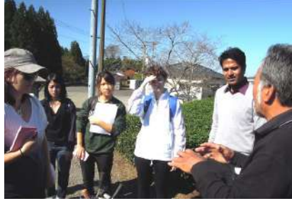
オーガニック茶園の説明