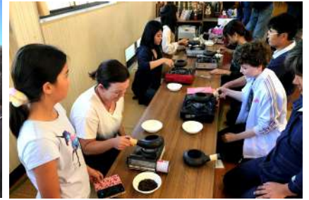
お茶の焙煎・ブレンド体験