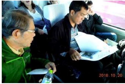
車中での事前説明

次に向かった武家屋敷の散策では、保存会の方の説明を受けながら、昔ながらの武家門を見学し、歴史と文化を体感しました。参加した外国人の方からは「とても良かった。面白く本物を味わえた体験でした」や「人がフレンドリーで興味深く歴史を感じることが出来ました」などの感想がありました。