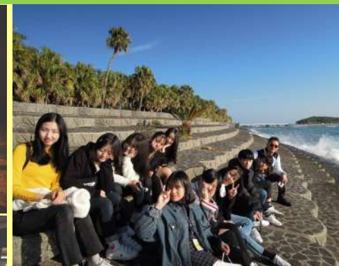
左端:チーズ饅頭作り体験 中央上段:生目の杜遊古館での花火 中央下段:夕食会での最後のお別れ 右端:朝の青島散策