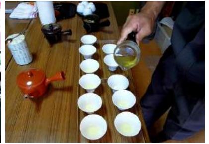
美味しいお茶の淹れ方体験