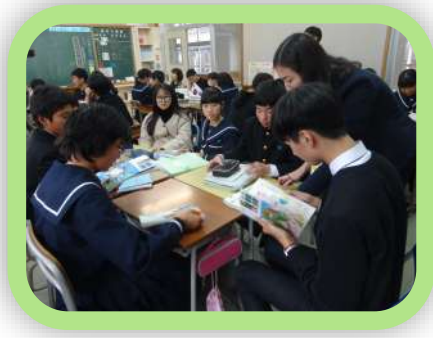
生目中学校での交流会