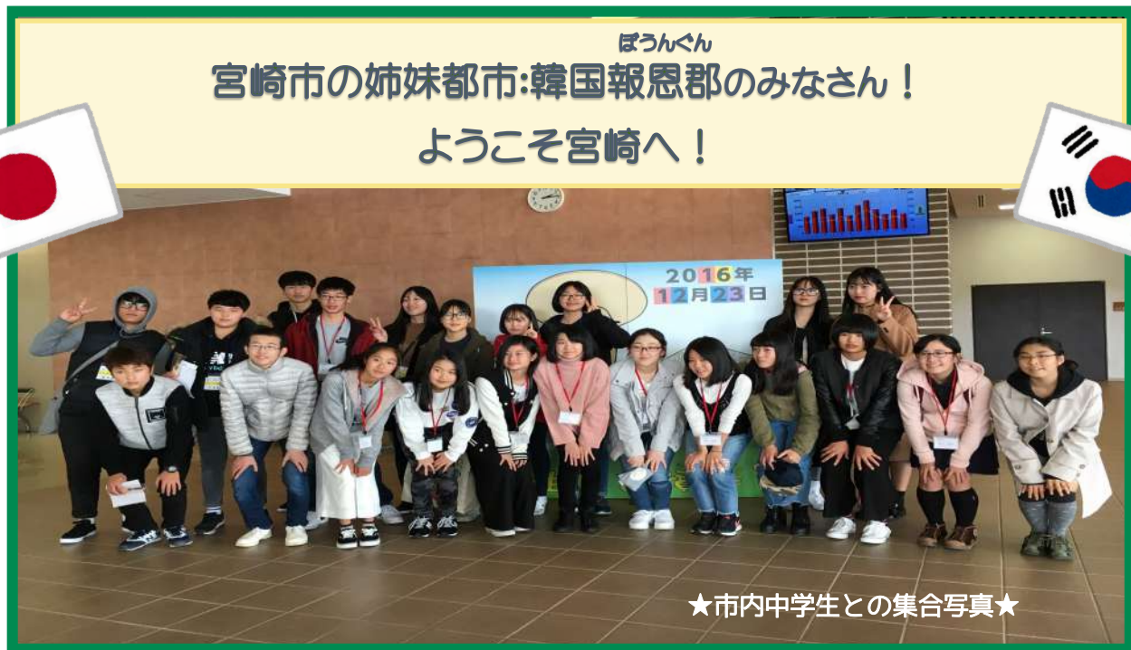
★市内中学生との集合写真★